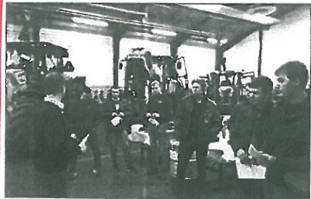
Unge fra Sydjysk Landbougdom på besøg hos A.P. Jørgensen.