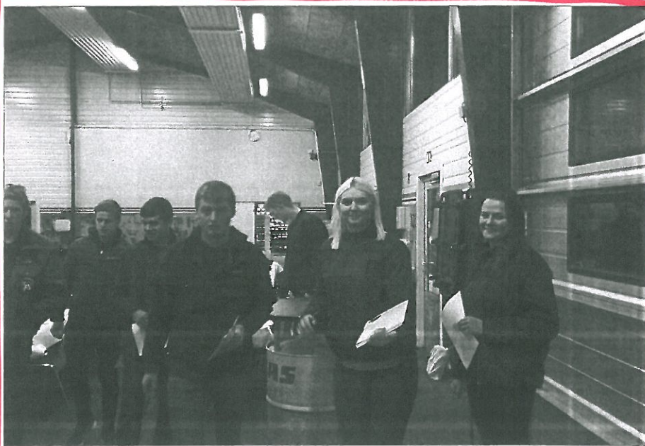
Der var stort fremmøde af unge af begge køn hos A.P. Jørgensen, da Sydjysk LandboUngdom besøgte den 120 år gamle virksomhed.